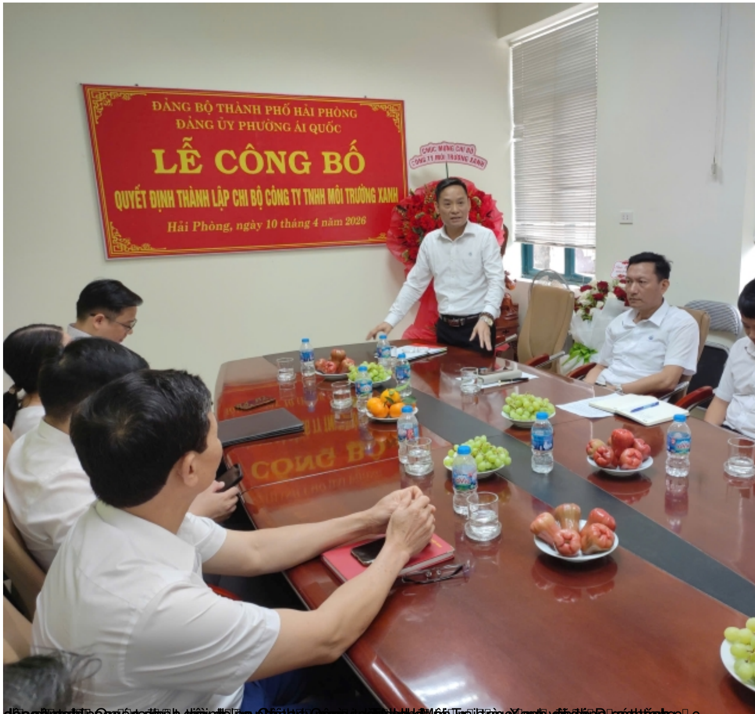
đồng nghiệp Công ty đã định ngày 10 tháng 4 năm 2026 tại Công ty TNHH Môi Trường Xanh và đồng nghiệp c

Thứ ba, 14 Tháng 4 2026 01:42 - Cập nhật lần cuối Thứ ba, 14 Tháng 4 2026 01:53