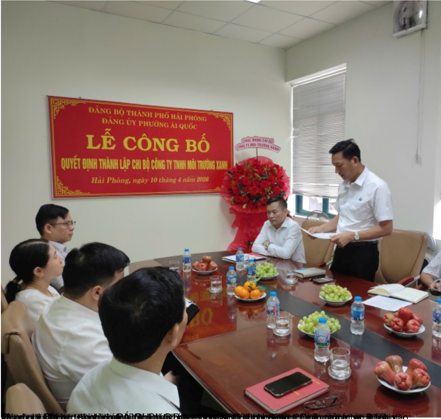
Ảnh ghi lại buổi lễ công bố quyết định thành lập chi bộ Đảng tại Công ty TNHH Môi Trường Xanh;

Tuesday, 14 April 2026 01:42 - Last Updated Tuesday, 14 April 2026 01:53