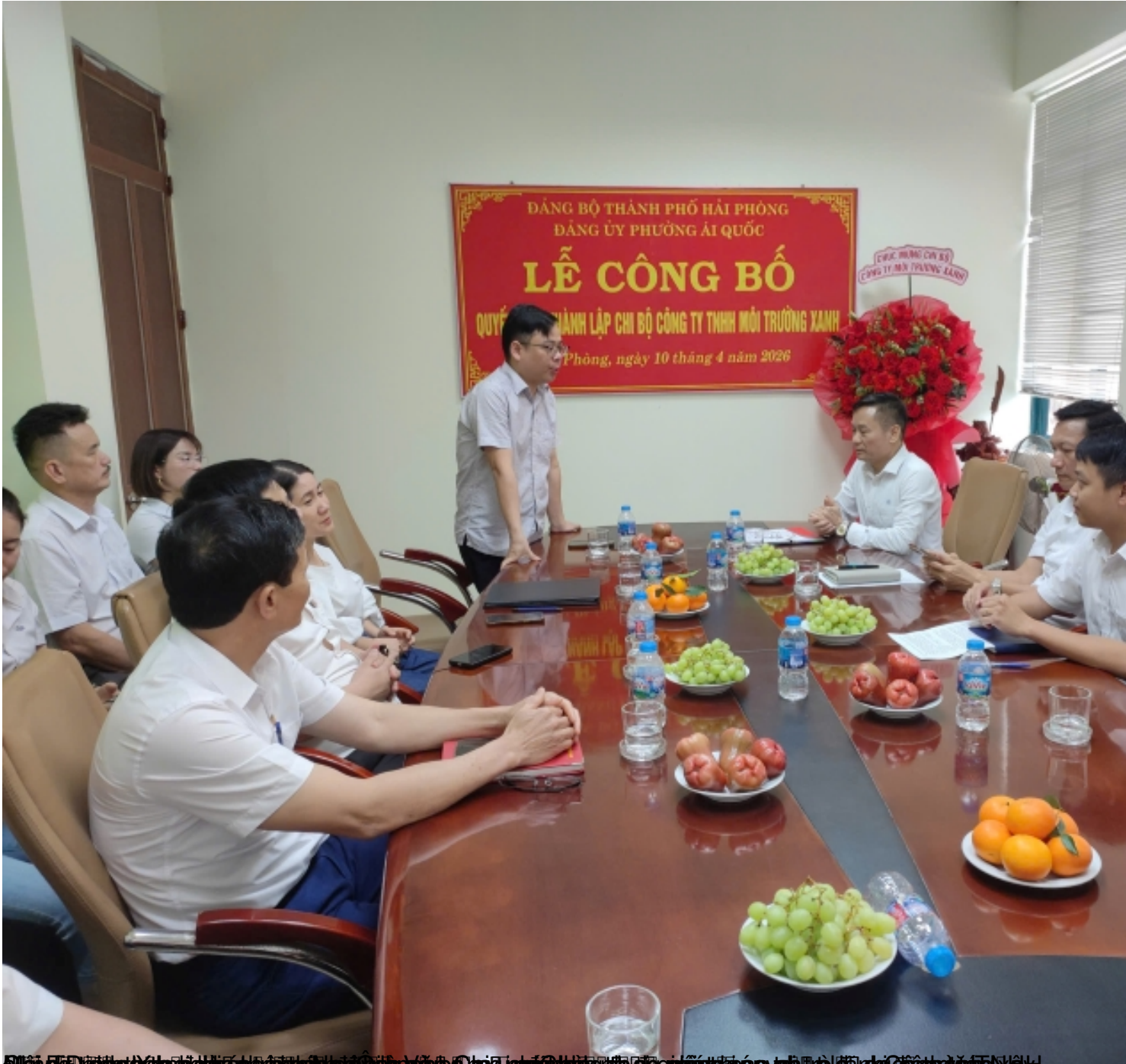
Ảnh ghi lại buổi lễ công bố quyết định thành lập chi bộ Công ty TNHH Môi Trường Xanh.

Tuesday, 14 April 2026 01:42 - Last Updated Tuesday, 14 April 2026 01:53